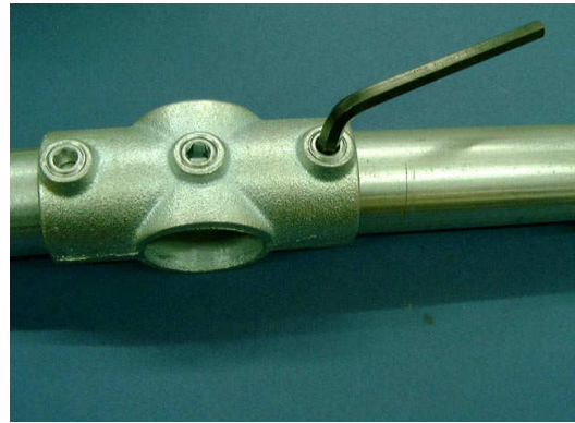
② 2-3X 試験製品