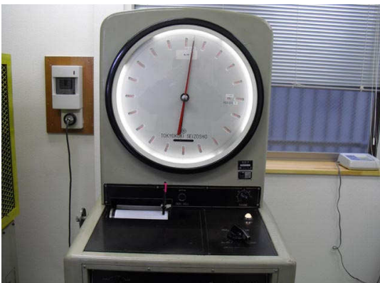
⑤ 最大50~1ton測定可能 5tonに設定