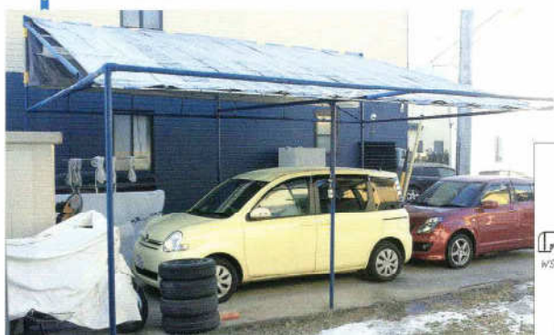
▲完成したガレージの屋根 製作費¥80,000(かん太26個、鉄パイプ6m×20本、 防水シート、柱塗装、含む)作業日数3日間