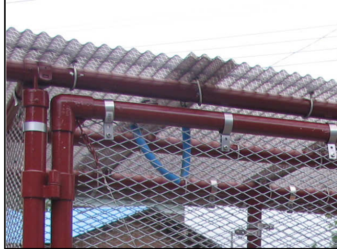
エキスパンドメタルの仮取付