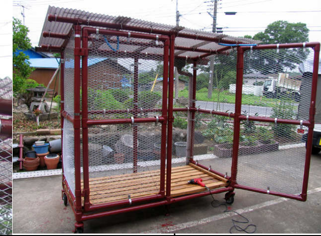
スノコ取付・網取付金具本止め