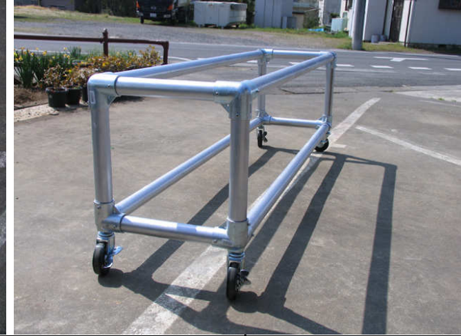
組立完了 塗装はここで行う